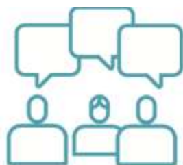
FORO DE ACTUALIZACIÓN