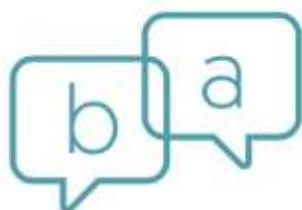
MESA DE CONTROVERSIAS