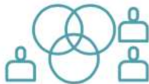
FORO MÉDICO CULTURAL