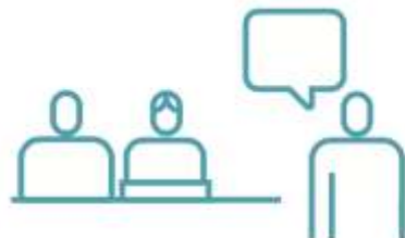
CASOS CLÍNICOS COMENTADOS